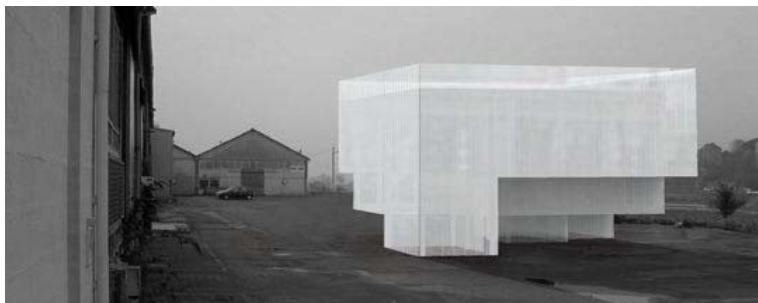
Open climate, implantation du pavillon de 92m2 sur l'île de Nantes. Projet : 2006.